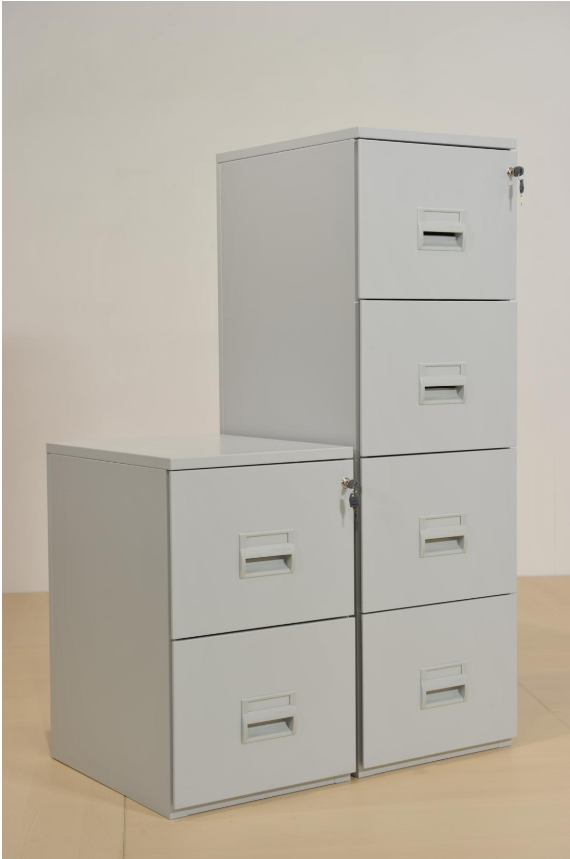
CLASSEURS METALLIQUES 2 et 4 TIROIRS